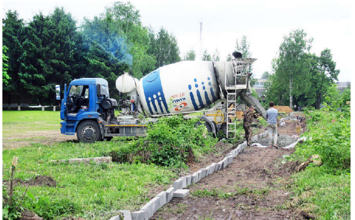
Ведутся работы на стадионе: произведено выравнивание и грейдирование поля, завозится грунт.

Начаты работы по благоустройству в парке райцентра: на ранее подготовленной площадке посеян газон, делается дорожка вокруг парка. Планируется, что 120-летие поселка и 90-летие района он встретит изменившимся до неузнаваемости, где и будет проходить праздник.